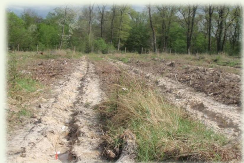
Avril 2014. Ligne préparée au Razherb®+Sous soleur