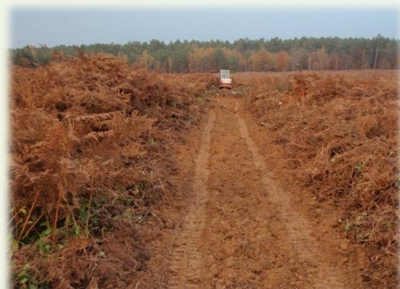
Novembre 2013. Préparation au Scarificateur réversible®