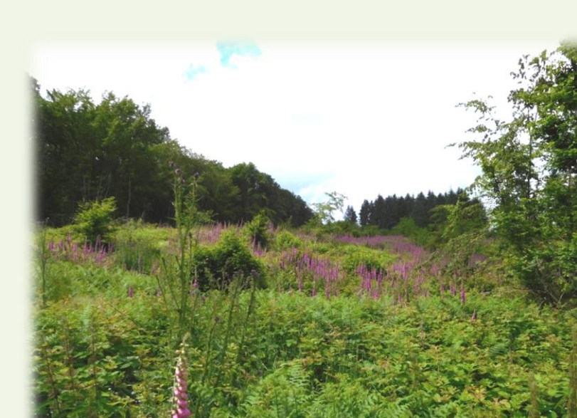
Juin 2016. Mélange ronce - fougère