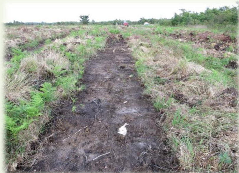
Juillet 2014. Ligne préparée au Razherb®