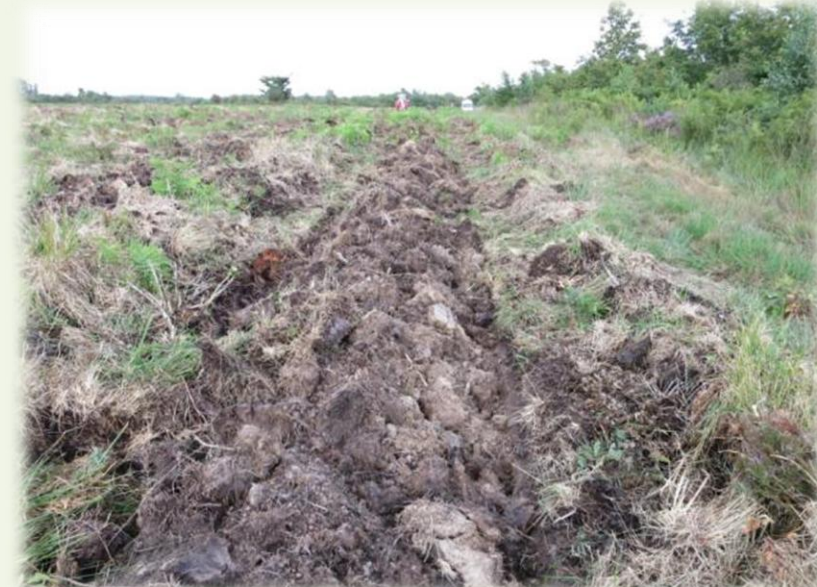
Juillet 2014. Ligne préparée au Culti 3B®