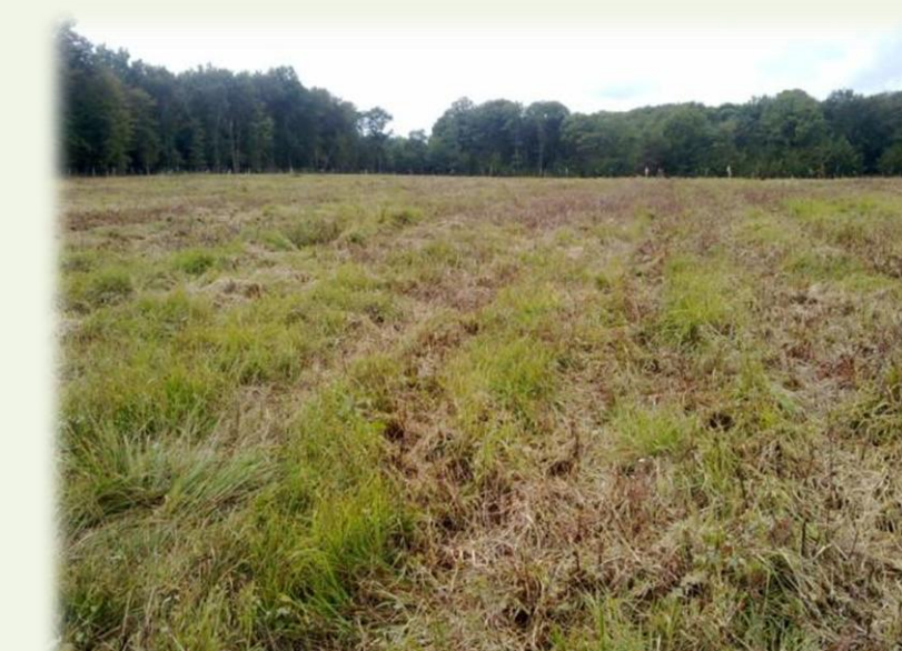
Octobre 2013. Parcelle envahie par la molinie