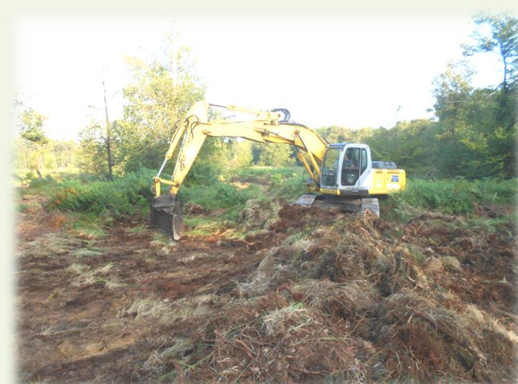
Janvier 2016. Préparation au Râteau Pompéi