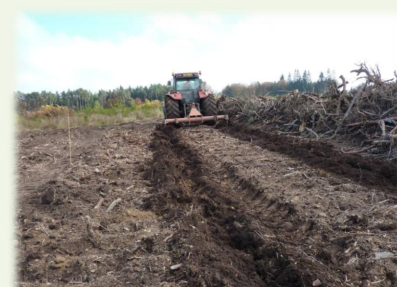
Octobre 2016. Préparation au sous-soleur double