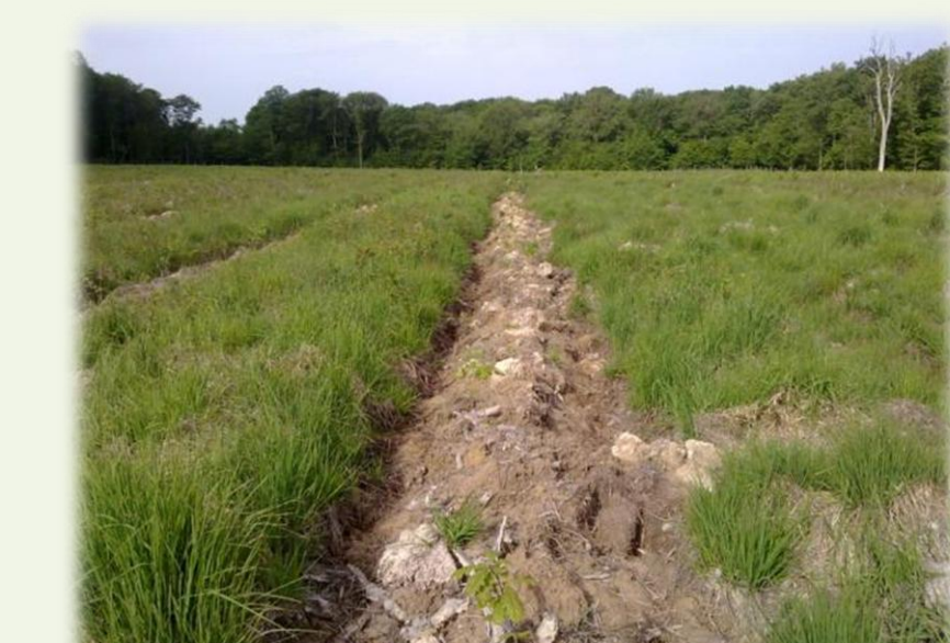
Mai 2014. Ligne préparée au Razherb+Sous soleur multifonction