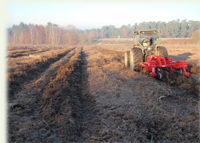
Décembre 2013. Préparation au Culti 3B®