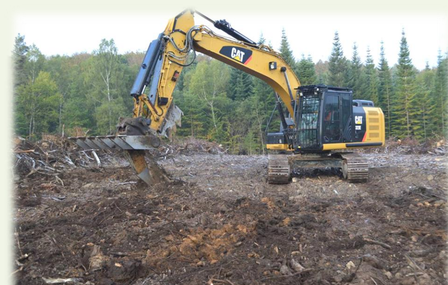
Octobre 2016. Préparation à la dent Bertrandie