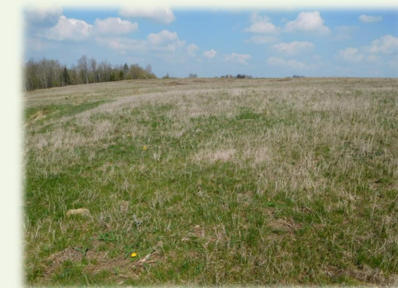
Avril 2017. Parcelle envahie par les graminées