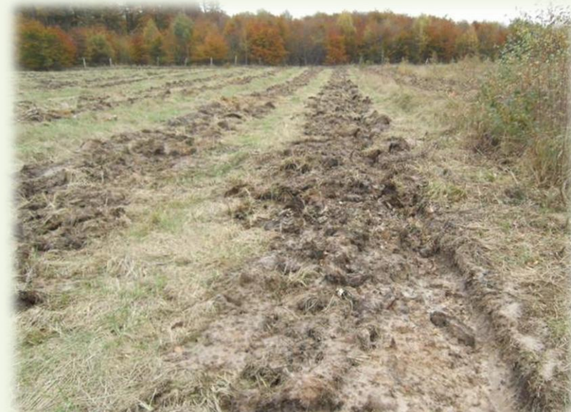
Novembre 2013. Ligne préparée à la Charrue bidisque motorisée