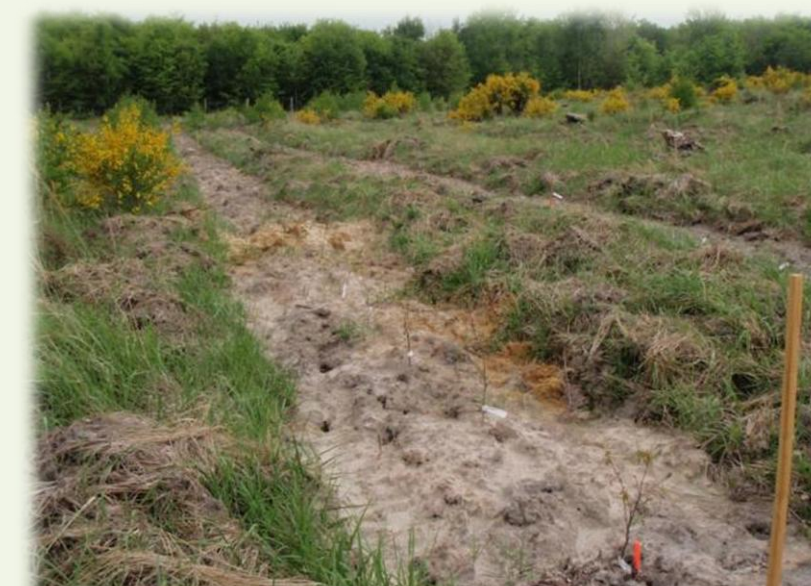
Avril 2014. Ligne préparée au Sous-soleur multifonction®