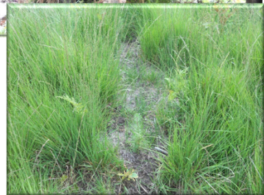
Broyeur Ahwi – 20-35 cm de profondeur