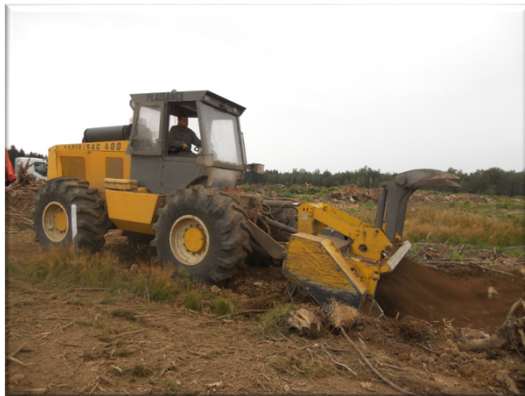
Broyeur lourd (300-400 ch) sur roue ou sur chenille