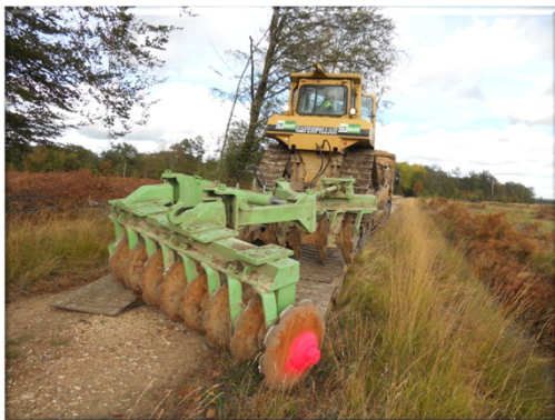
Bull avec cover- crop lourd