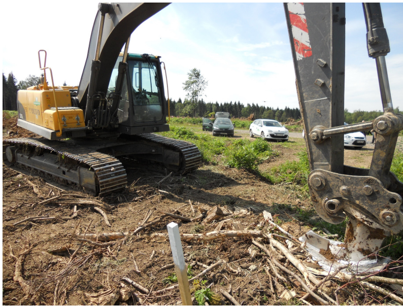
Dessouchage avec pelle de 23 tonnes et la dent de dessouchage Becker