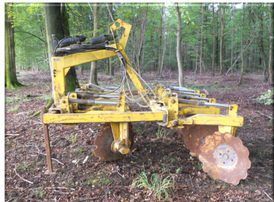
Tracteur avec cover- crop « léger »